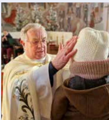
Kindersegnung am 28. Dezember 2024.