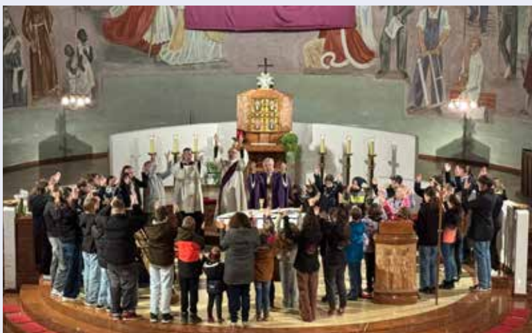
Beim Gottesdienst am Aschermittwoch feierten die Pfadfinder und Firmkandidaten in unserer Kirche mit.