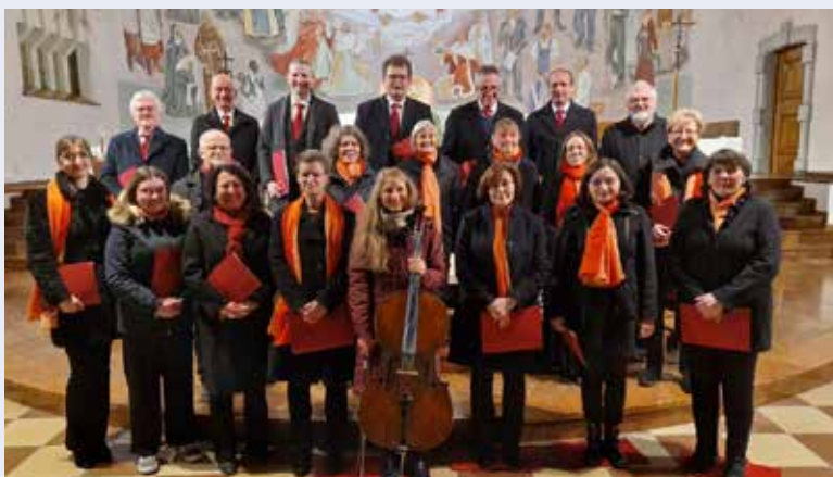
Der Kirchenchor der Pfarre Gmünd-Neustadt lud am 8. Dezember wieder zum traditionellen Adventkonzert.