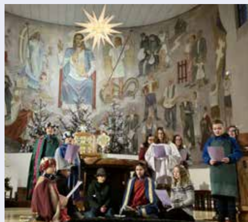
Die Mitwirkenden beim Krippenspiel am 24. Dezember 2024.