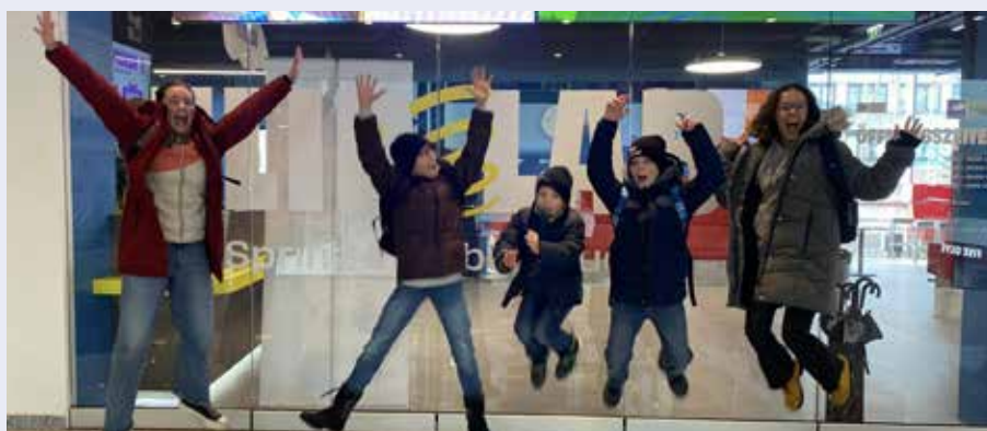
Die Ministranten haben im Februar einen Ausflug nach Wien gemacht und dabei Österreichs größte Trampolinhalle besucht.