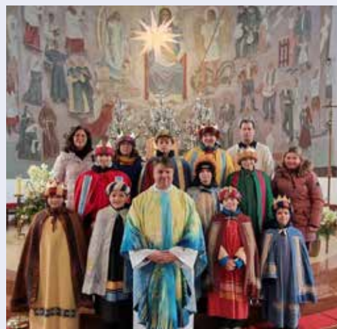
Wir danken allen Sternsängern in unserer Herz-Jesu-Pfarre.