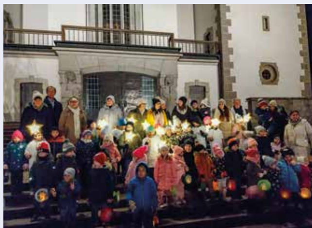
Das Martinsfest des Kindergartens Gmünd-Neustadt führte vor die Herz-Jesu-Kirche.