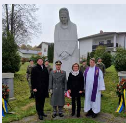
Allerheiligengedenkfeier 2024 beim Denkmal vor unserer Kirche.