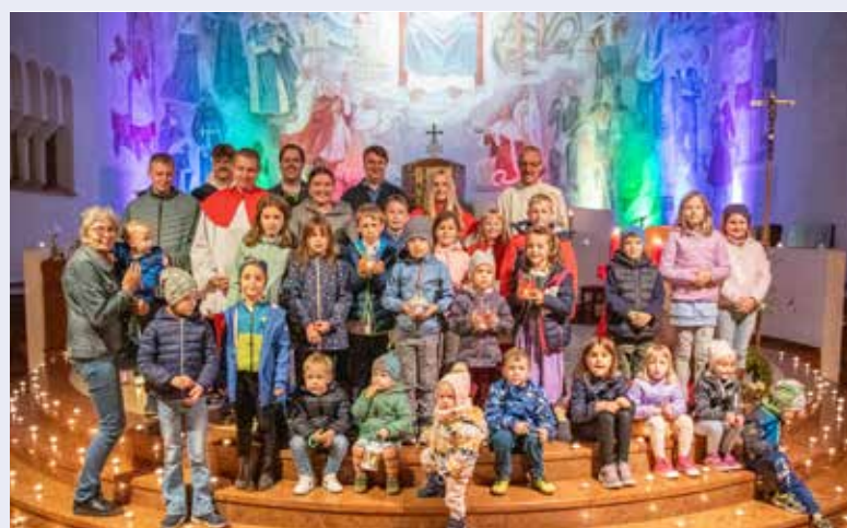
Bei der „Nacht der 1.000 Lichter“ konnten in unserer Kirche wieder viele Kinder begrüßt werden.