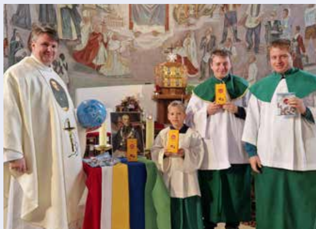
Am Weltmissionssonntag haben wir auch an die Oblatenmissionare in der Welt gedacht.