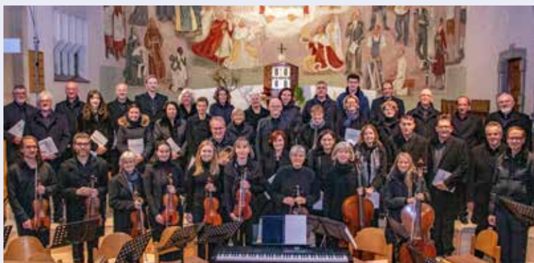
Viele Zuhörer gab es beim Requiem-Konzert der Kirchenmusik Gmünd-Neustadt am 9. November 2024.