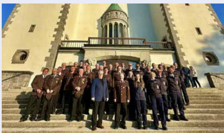
Anfang Mai feierten die Kameraden der Freiwilligen Feuerwehren die Florianimesse in unserer Kirche.