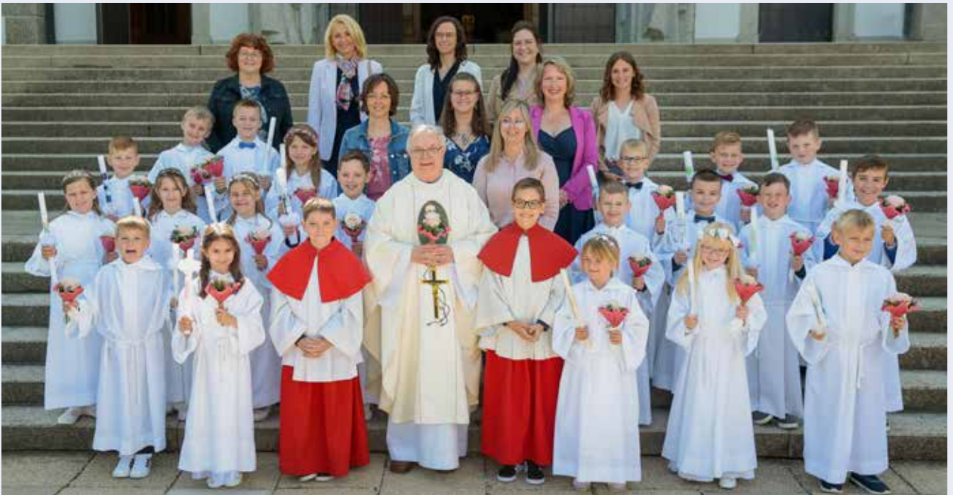
Erstkommunion in der Pfarre Gmünd-Neustadt am 9. Mai 2024