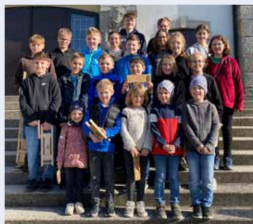
Danke an alle Ratscherkinder unserer Pfarre für ihren Einsatz.