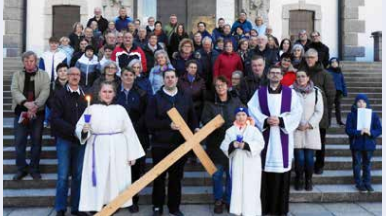
Mitte März wurde zu einem grenzüberschreitenden und ökumenischen Stadtkreuzweg eingeladen.