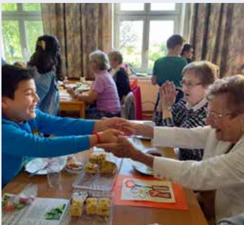
Kinder der Gmünder Volksschule besuchten unsere Seniorenrunde.