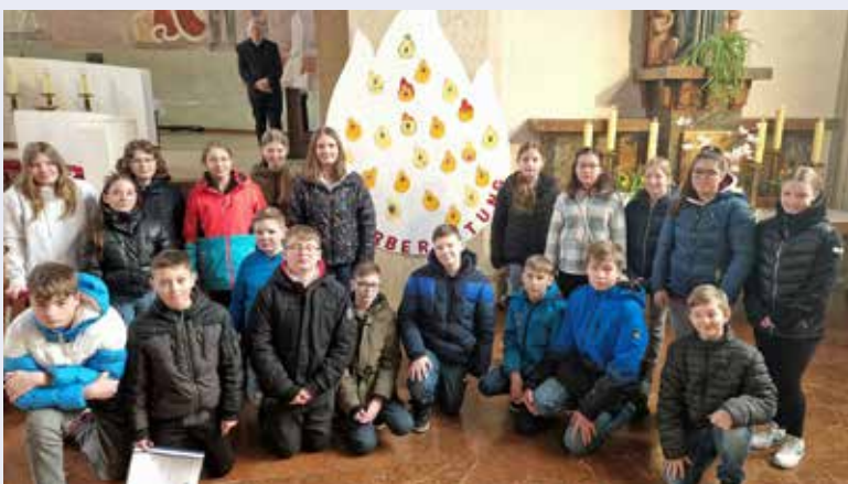
Vorstellung der Firmkandidaten im Rahmen des Gottesdienstes am 3. Fastensonntag.