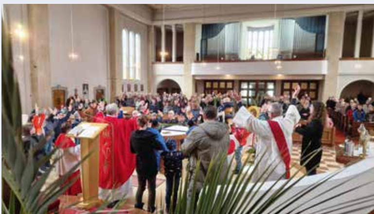
Viele Kinder und Familien konnten am diesjährigen Palmsonntag in unserer Kirche begrüßt werden.