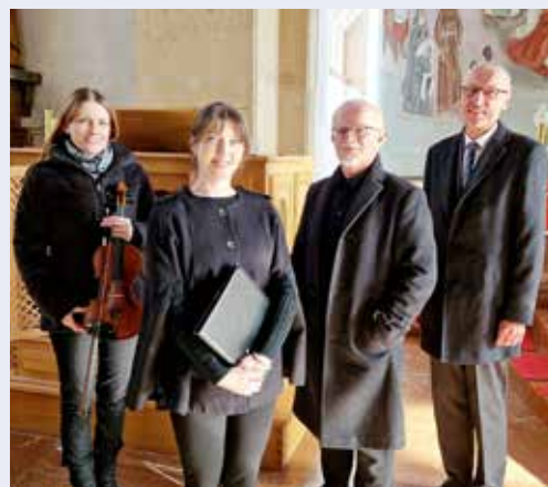
„memoria passionis“ 2024: Musik und Wort zum Passionssonntag.