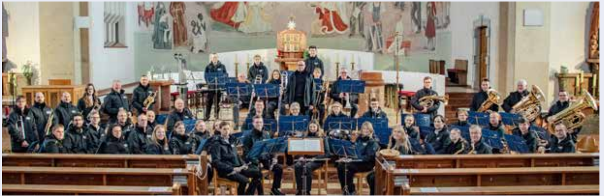
Am zweiten Adventsonntag lud die Stadtkapelle Gmünd zum Adventkonzert in die Herz-Jesu-Kirche in Gmünd-Neustadt ein.