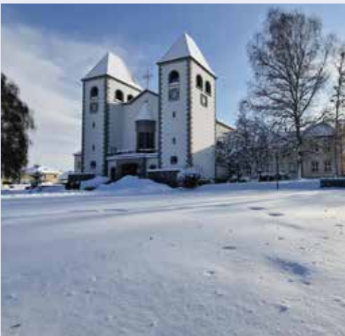
Wir danken allen für die Hilfe beim Schneedienst in unserer Pfarre.