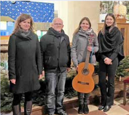
Abendmusik „Musik an der Krippe“ am 26. Dezember 2023.