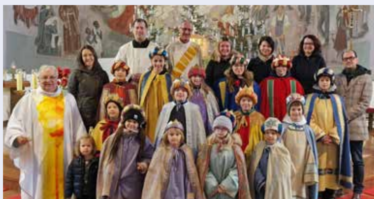
Wir danken allen 36 Sternsängern in unserer Pfarre, die heuer den Segen von Haus zu Haus getragen haben.