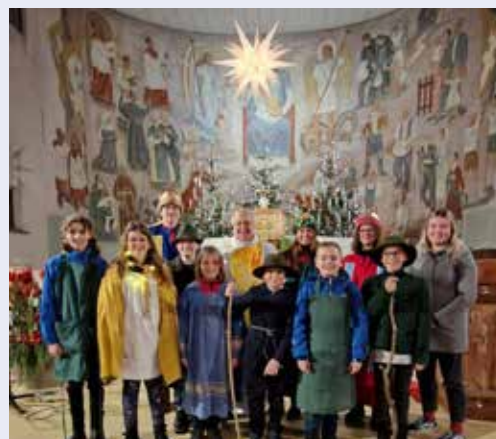
Die Mitwirkenden beim Krippenspiel am 24. Dezember 2023.