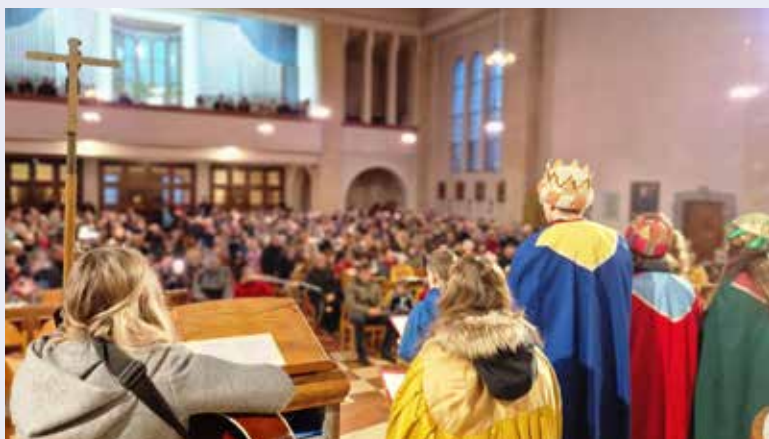
Im Rahmen der Kindermesse fand auch heuer wieder ein Krippenspiel für die Kinder und Familien statt.