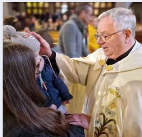
Traditionelle Kindersegnung am 28. Dezember 2023.