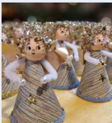
Vielen Dank für die Engel bei der Kindersegnung!