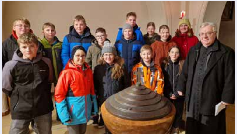
In unserer Herz-Jesu-Pfarre bereiten sich insgesamt 15 Firmkandidaten auf das Sakrament der Firmung vor.