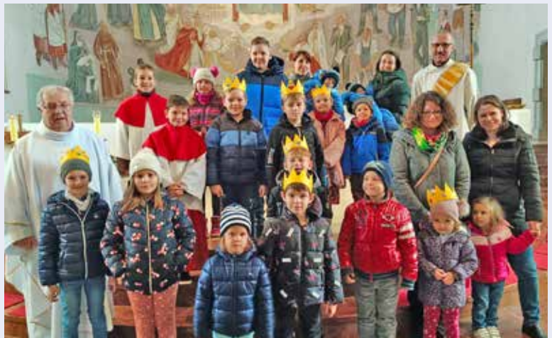
Am Christkönigssonntag begingen die Kinder und Familien beim KiWoGo das Ende des Kirchenjahres.