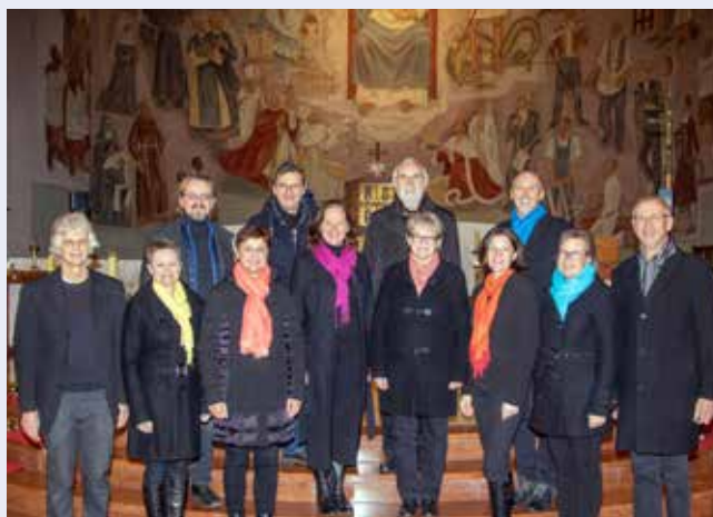
Im Rahmen von „Kultur.Raum.Kirche“ luden im November „Die Tonträger“ zu einem Konzert.