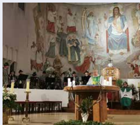
Die Jägerschaft feierte im November wieder die Bezirkshubertusmesse.