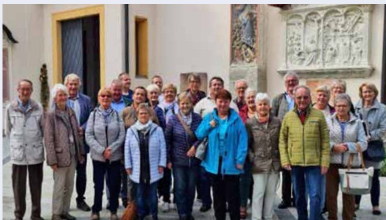
Die Pfarrwallfahrt führte in diesem Jahr zum Sonntag-berg und nach Waidhofen an der Ybbs.