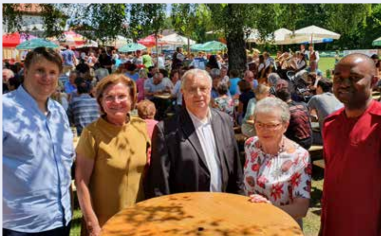
Das 40. Pfarrfest im Juni war, trotz der Unwetter der Vorwoche, ein voller Erfolg. Danke allen Besuchern!