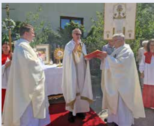
Zu Fronleichnam führte die Prozession wieder zum Haupttor.