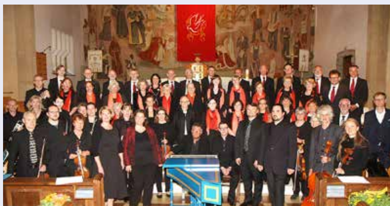
Im Juni wurde in der Herz-Jesu-Kirche Georg Friedrich Händels „Messiah“ vom Kirchenchor aufgeführt.