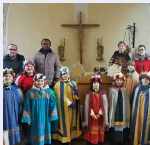
Vielen Dank an die Sternsinger von Wielands!