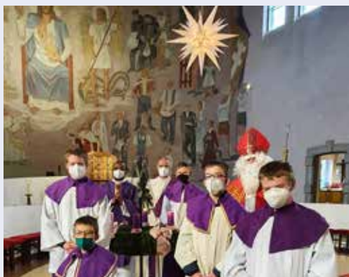
Besuch des Nikolaus beim Gottesdienst am 5. Dezember 2021.