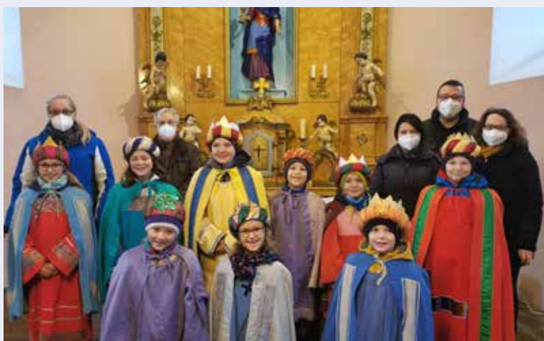
Wir danken den Sternsängern aus Ehrendorf für ihr Engagement.