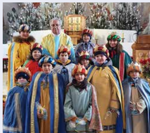
Der Gottesdienst mit unseren Sternsängern am 6. Jänner 2022.