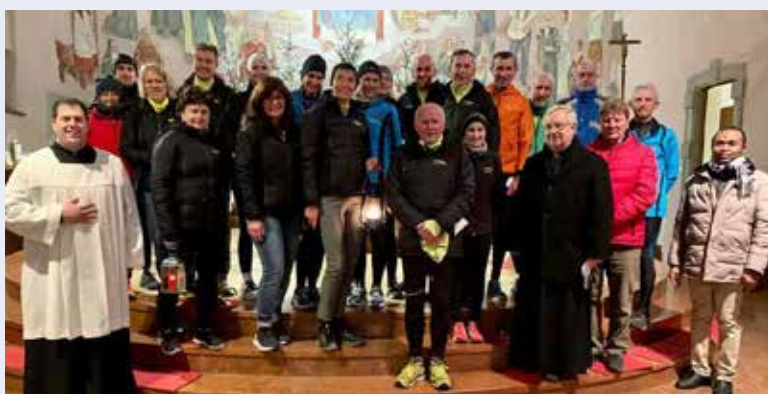
Das Laufteam Gmünd brachte am 23. Dezember 2021 das Friedenslicht aus Betlehem in unsere Kirche.