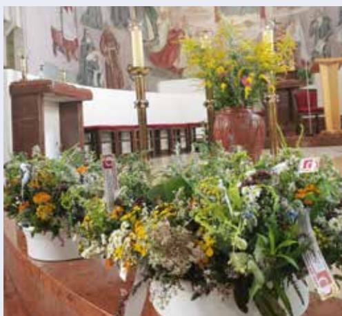
Die Kräuterweihe fand auch dieses Jahr wieder am 15. August statt.