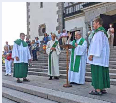
Am Christophorussonntag fand die traditionelle Autosegnetz statt.