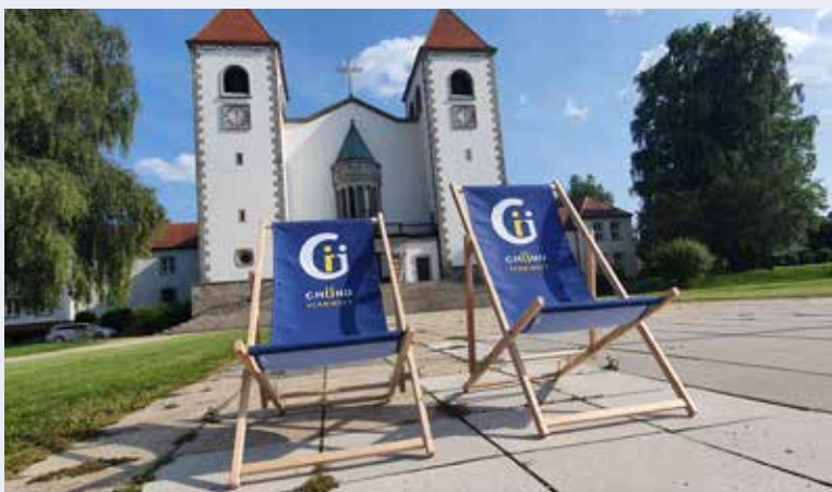
Vor der Kirche wurden im Sommer durch die Stadtgemeinde Gmünd gemütliche Klappsessel aufgestellt.