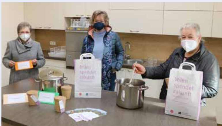
Am Suppensonntag (7. März) wurden Suppen und Einlagen „coronabedingt“ zum Mitnehmen angeboten.