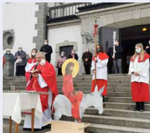
Feier des Palmsonntags mit Palmweihe vor der Pfarrkirche.