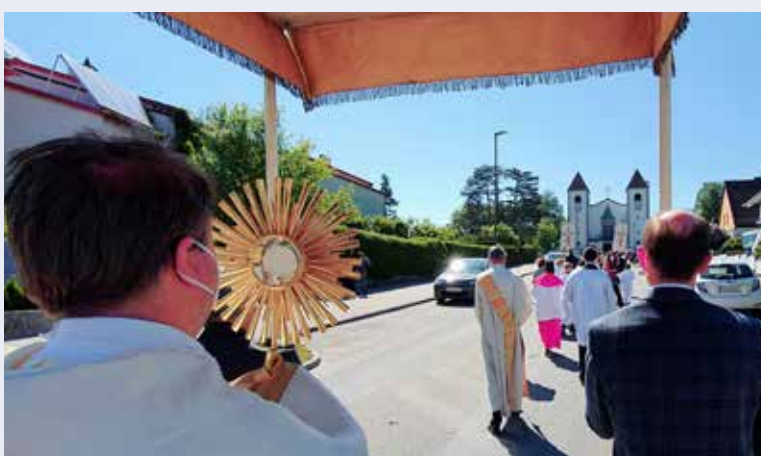
Zu Fronleichnam konnte auch heuer die Prozession mit strengen Sicherheitsvorschriften durchgeführt werden.