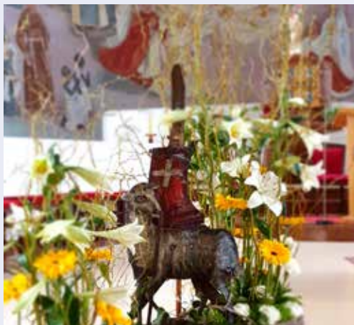
Blumenschmuck zum Osterfest 2021 in unserer Kirche.