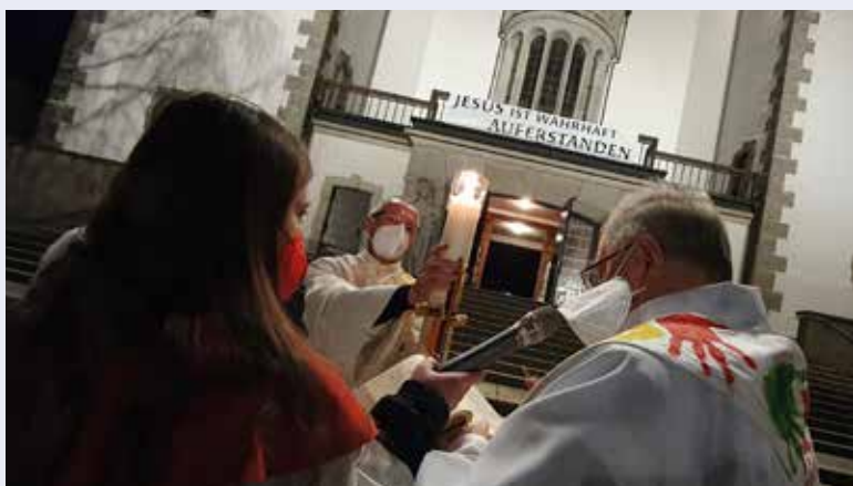
Trotz Corona-Pandemie und Anmeldepflicht war die Osternacht in diesem Jahr ein besonderer Gottesdienst.