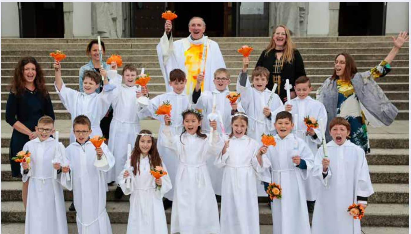
Erstkommunionkinder der 3. Klasse der VS Gmünd (30. Mai 2021)