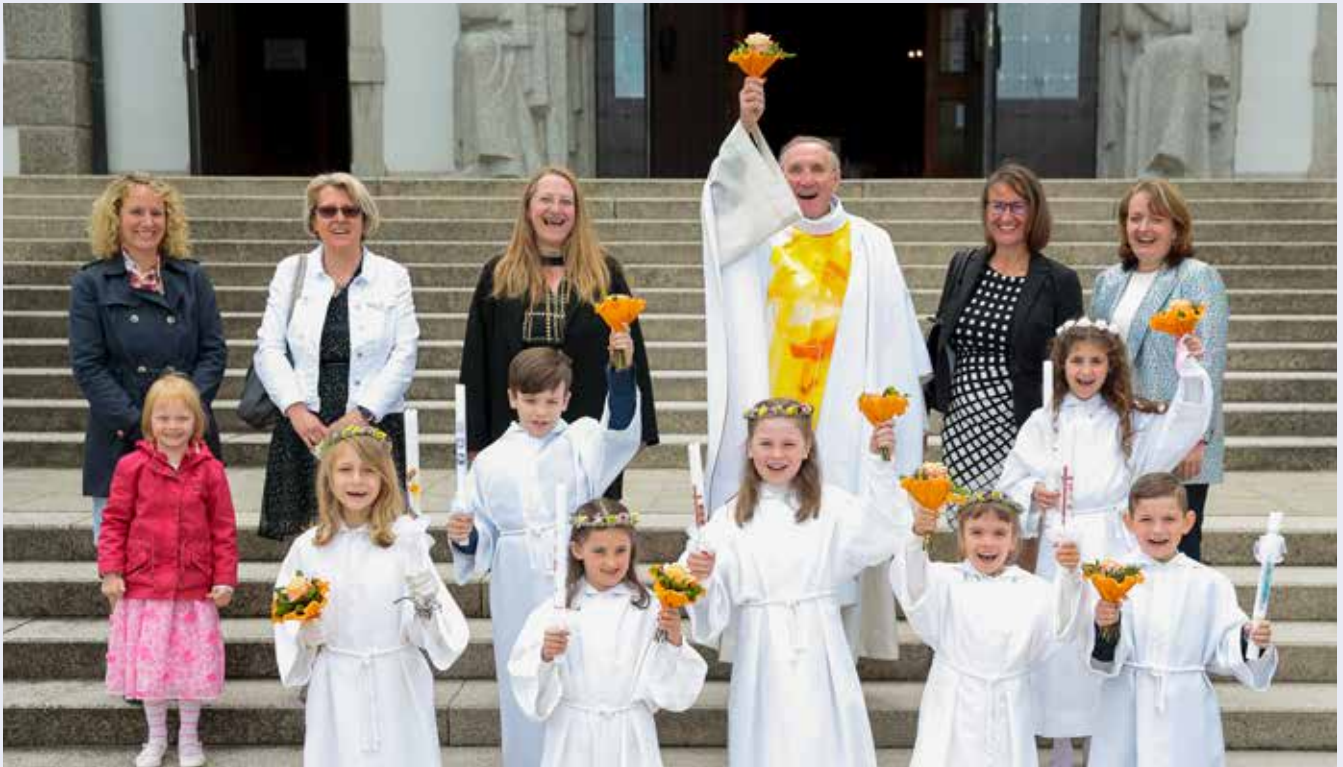
Erstkommunionkinder der 2. Klasse der VS Gmünd (30. Mai 2021)