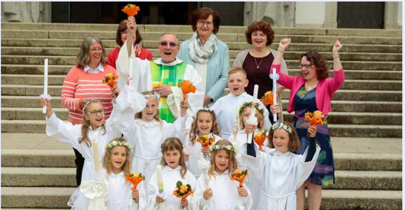
Erstkommunionkinder von Ehrendorf und Wielands (6. Juni 2021)