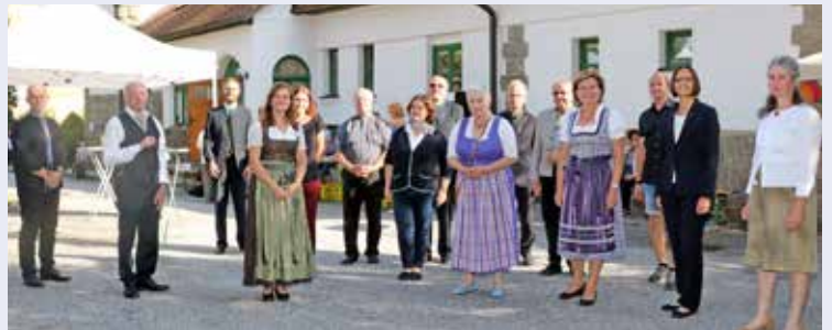
Bei der „Kreuzeröffnung“ der evangelischen Pfarre waren auch Vertreter unserer Pfarre mit dabei.