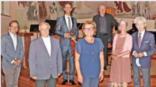
Mitte August fand der Auftakt für „Allegro Vivo“ in unserer Kirche statt.

Die Bibel leben: Die Texte der Bibel berühren das Leben. Durch sie möchte Gott mit den Menschen ins Gespräch kommen. Manchmal braucht es Mut, darauf im Leben eine Antwort zu finden. Woche für Woche versammeln wir uns in den Kirchen, um das Wort Gottes zu hören.