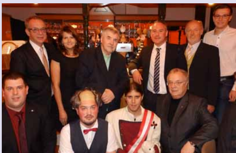
Mit einem unterhaltsamen Sketch eröffnete die katholische Jugend Gmünd ihren bereits fünften Ball in der Taverna Perikles in Gmünd zum Thema „K & KJ Hofbalty“.