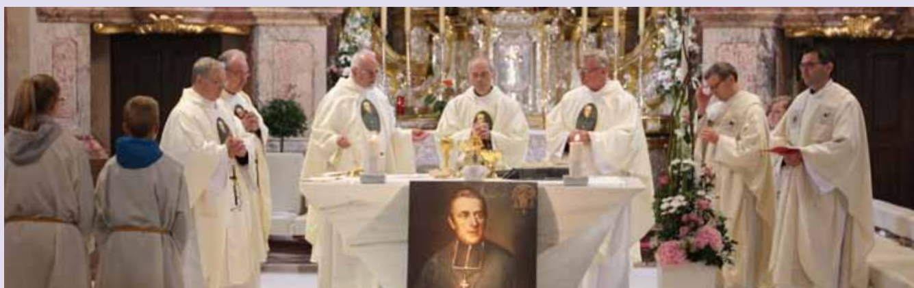
Mit einer großen Sternwallfahrt nach Maria Taferl aus allen ordenseigenen Pfarren Österreichs feierten die Oblaten der Makellosen Jungfrau Maria (OMI) am Sonntag, 9. Oktober 2016, ihr 200-jähriges Bestehen.