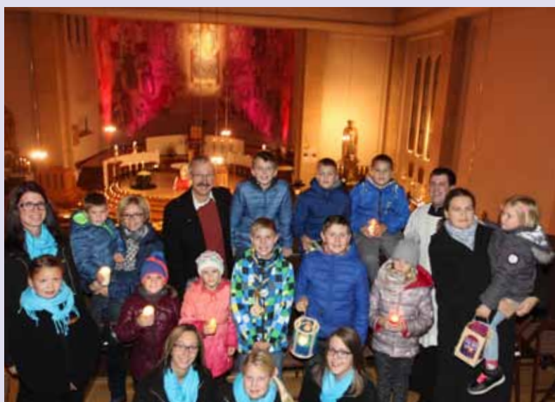
Unsere Herz-Jesu-Kirche wurde im Rahmen der „Nacht der 1000 Lichter“ am 31. Oktober 2016 wieder von hunderten Kerzenlichtern erhellt.