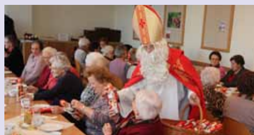
Bei der Dezember-Seniorenrunde war auch der Nikolaus zu Gast und überbrachte ein kleines Geschenk.