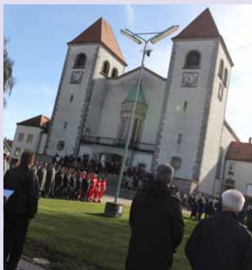
Allerheiligengedenkfeier zu Ehren der Opfer beider Weltkriege vor der Kirche.