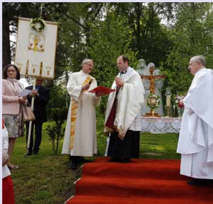
Das Fronleichnamsfest führte die Pfarrgemeinde heuer wieder in den Flüchtlingspark.