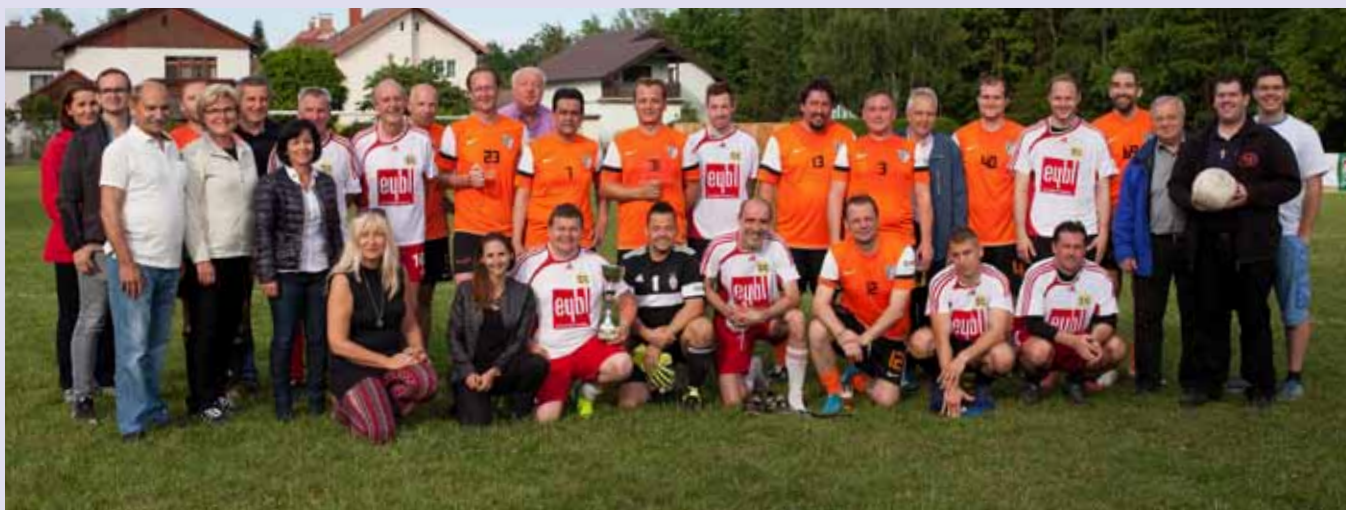
Im Rahmen unseres Pfarrfestes in Gmünd-Neustadt lud die Katholische Jugend Gmünd zu einem Benefiz-Fußballturnier. Die Gmünder Fußballlegenden kickten dabei gegen Gmünds Stadtpolitiker – gewonnen haben schließlich die Fußballlegenden.