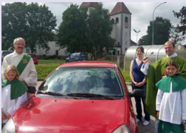
Am Christophorussonntag fand in unserer Pfarre wieder die traditionelle Fahrzeugsegnung statt.