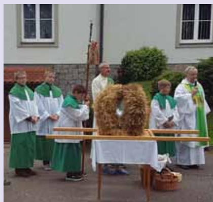
Das Erntedankfest wurde in unserer Pfarre am 18. September gefeiert.