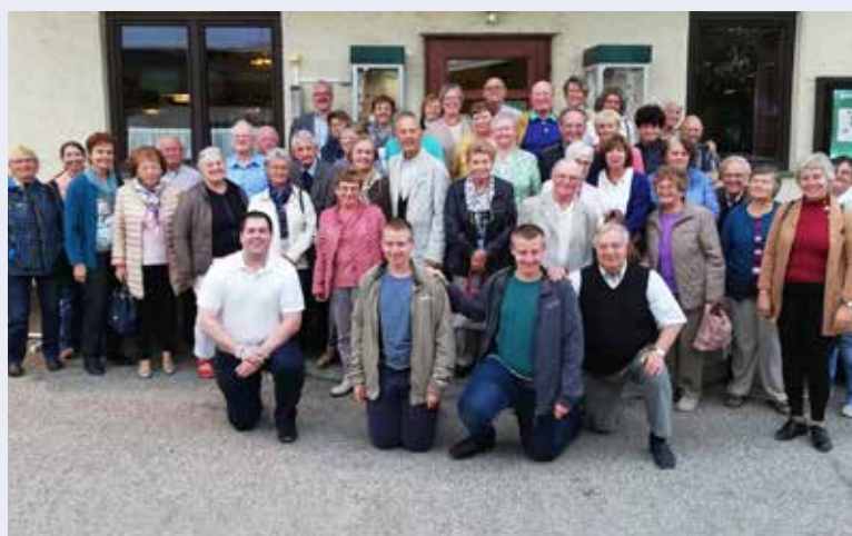
Ziel der Pfarrwallfahrt am 22. September war das Zisterzienserstift Schlierbach in Oberösterreich.