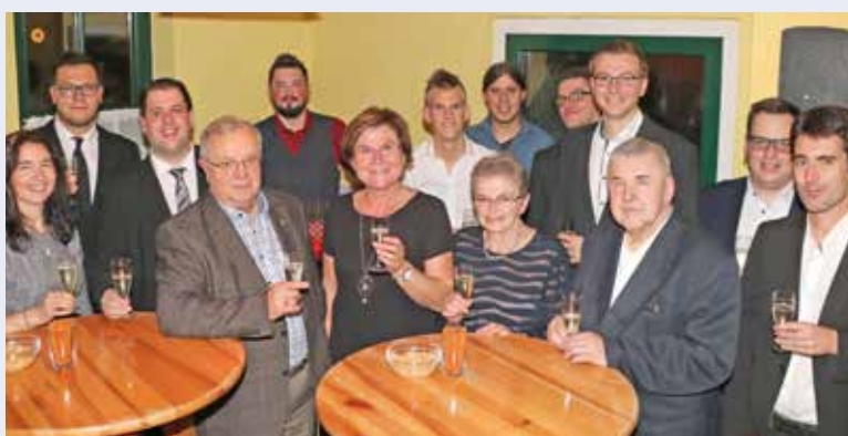
Heuer lud die Katholische Jugend zu ihrem Balty unter dem Motto „MA 3950“ in das Gasthaus Traxler ein.