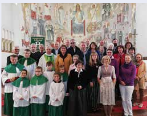
Erntedank mit den Bäuerinnen des Bezirkes Gmünd.