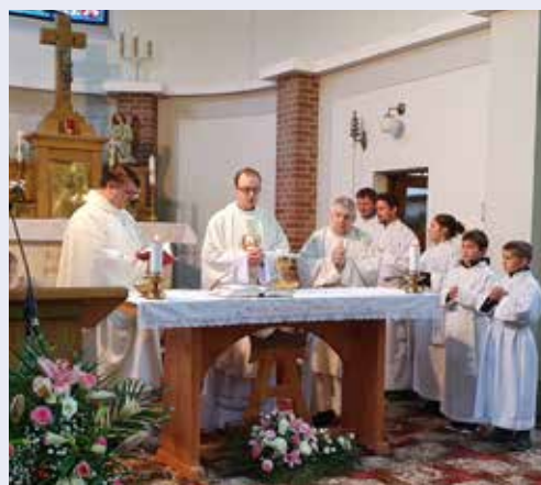
Patrozinium in der Pfarrkirche von České Velenice Anfang November.