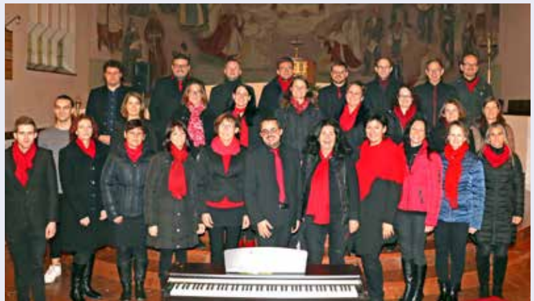
Anlässlich ihres 20-Jahr-Jubiläums luden die „Spiritual Voices“ wieder zu ihrem Konzert in die Kirche ein.