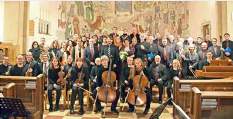
Der Kirchenchor Gmünd-Neustadt lud Ende September zum Konzert „Alexanders Feast“ in die Kirche.