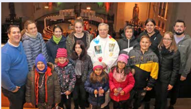
Zur „Nacht der 1000 Lichter“ lud heuer wieder die Katholische Jugend am Vorabend von Allerheiligen ein.